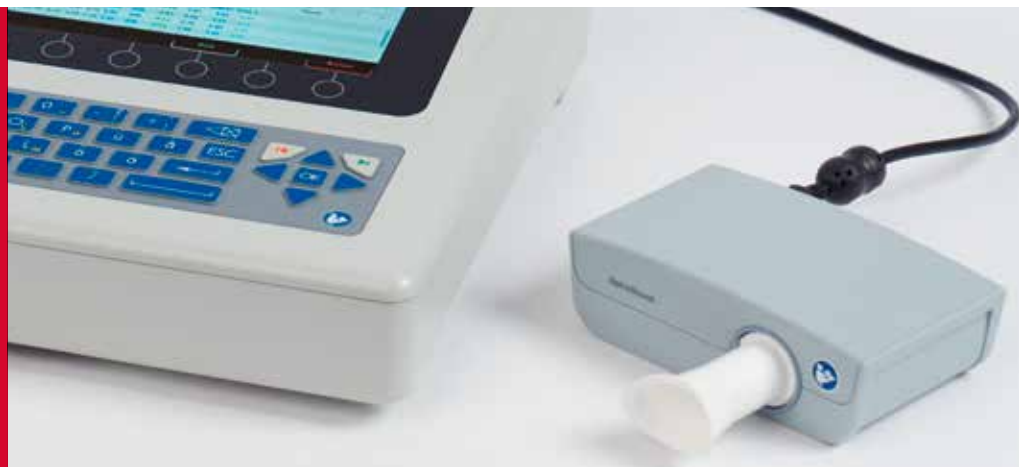
SpiroScout SP plus Spirometrieaufzeichnungen mit dem CARDIOVIT AT-102 G2